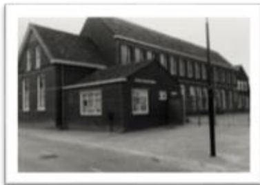
Onze Bouwsteen Kruishagelstraat

Het idee is om over 5 jaar, wanneer het gebouw er 25 jaar staat, een reünie te houden.