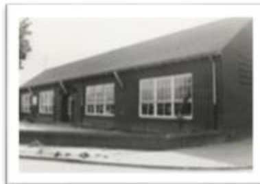
Oude Jongensschool Beugen